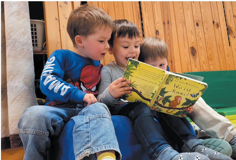
◀ Etliche Kinder haben im Spielgruppenraum im Pauli-Sport gespielt.