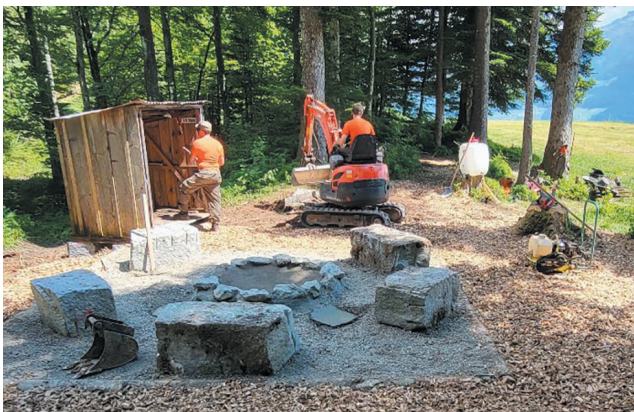
▲ Die neue Grillstelle bei der Nättschweid Fallenfluh wurde in Zusammenarbeit mit dem Zivilschutz fertiggestellt.

In den vergangenen Tagen wurde in der Nättschweid, Fallenfluh, eine neue Grillstelle aufgebaut. Die vorherige Grillstelle befand sich ein paar Meter weiter vorne – im Land von Hubert Bürgler. Durch die Verschiebung in das Waldinnere entstand ein neuer grosser Platz von rund 15 x 15 Meter. Der Boden ist mit Holzschnitzeln ausgelegt. Darauf zu finden sind Tischgarnituren, Bänke und ein Holzdepot. Die Grillstelle ist mit festen Steinen errichtet und lädt ab sofort zum Grillieren und Verweilen ein.