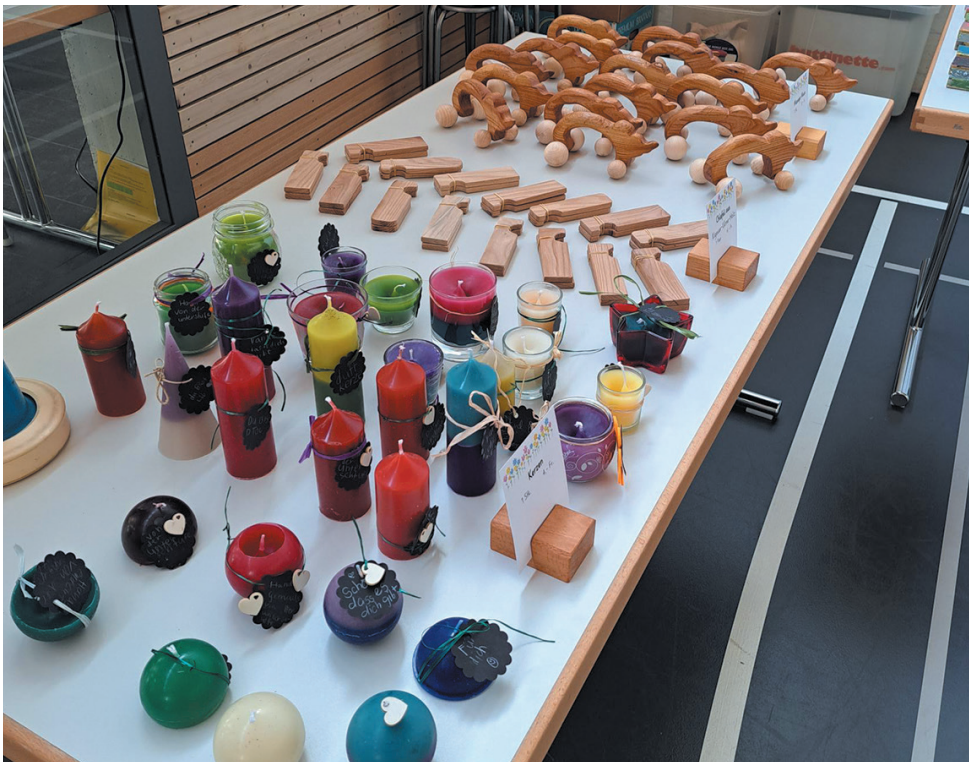
◀ An den Marktständen konnten selbstgemachte Sachen gekauft werden.

der Event von einer köstlichen kulinarischen Verpflegung und diversen musikalischen Unterhaltungen. Wir blicken auf ein grossartiges Fest zurück und freuen uns, dass wir vielen Besucherinnen und Besucher einen schönen Tag beschere konnten.