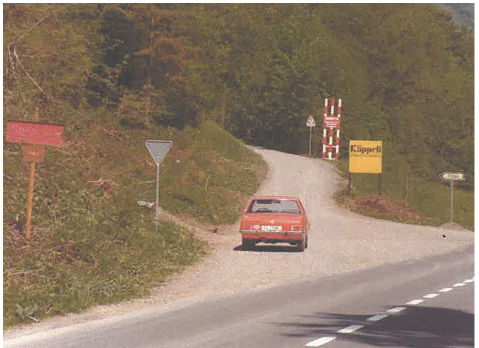
▲ Die Einfahrt nach Illgau mit der Beschilderung der 3.2 Kilometer langen Strecke.

Heute ist den wenigsten Strassenbenützern bewusst, welchen Gefahren man früher auf dieser Gemeindestrasse ausgesetzt war. Durch die Strasse wurde eine nachhaltige Entwicklung in der Berggemeinde möglich. Über hundert Jahre später ist sie nicht mehr wegzudenken.