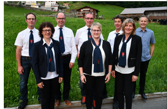
▲ Der neu zusammengesetzte Gemeinderat