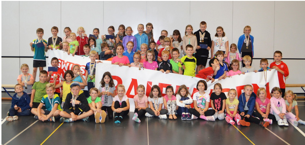
Die 70 teilnehmenden Kinder des Schülersporttages in Illgau machten begeistert mit.