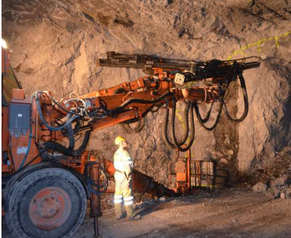
Erstellen Bohrlöcher für Sprengladungen Tunnelausbruch