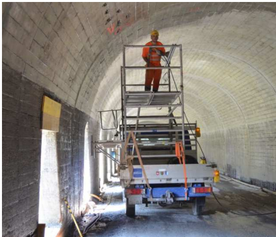
Reinigung Tunnel mit Hochdruckwasser