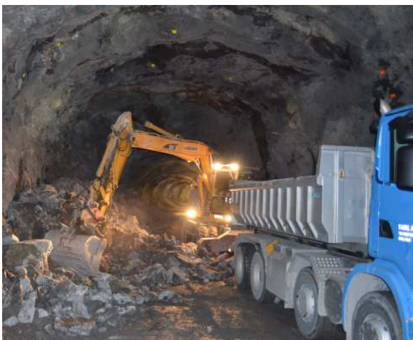
Auflad und Abtransport Ausbruchmaterial nach Profilausweitung mittels Sprengung