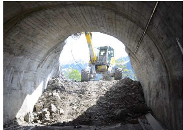
Felsabbruch vor dem teilweise abgebrochenen Vortunnel