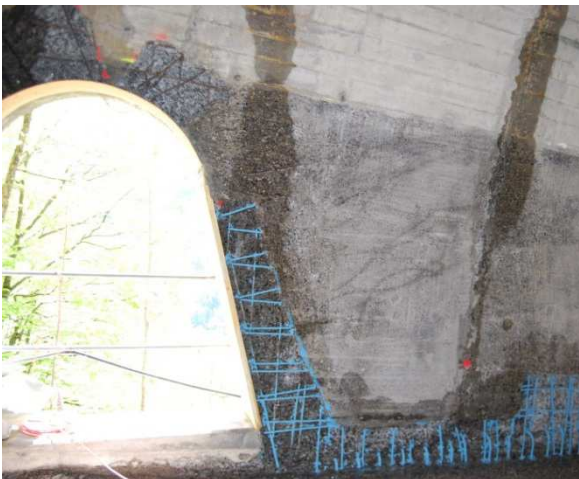
Behandelte schadhafte Armierungen bereit zur Reprofilierung