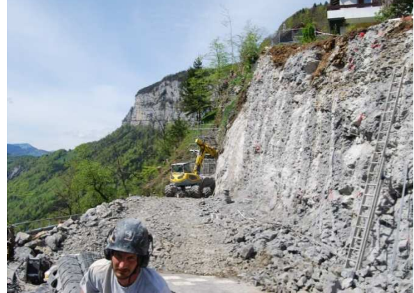
Felsabbruch im Bereich Vortunnel