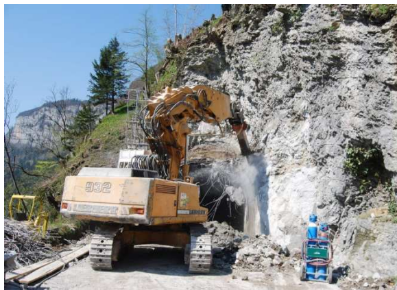
Abbruch des Vortunnel mit schwerem Abbauhammer