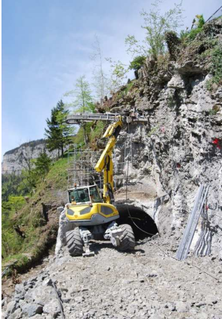
Felsabbruch im Bereich des alten Vortunnels

Telefon: 041/ 830 10 06 Telefax: 041/ 830 10 57 Homepage: www.illgau.ch E-Mail: gemeinde@illgau.ch