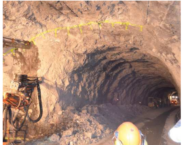
Vorbereitung Sprengung für Profilaufweitung