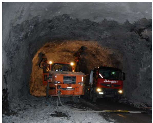
Enge Platzverhältnisse im Tunnel für Abtransport Material