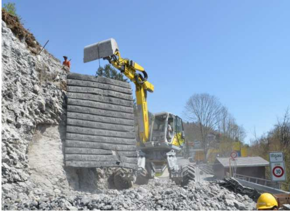
Versetzen Schutzmatte für Sprengung Felsabbruch