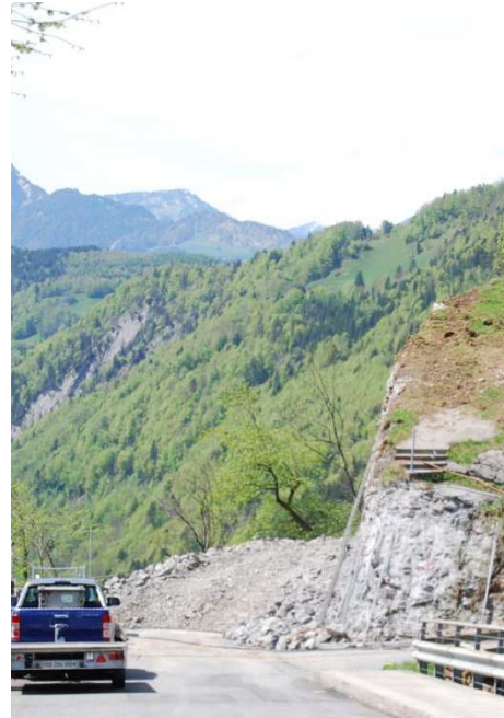
Freie Sicht nach Abbruch des Fels