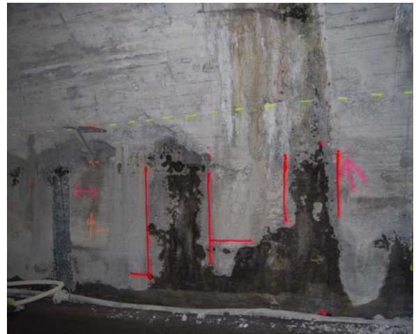
Markierung der schadhaften Betonflächen an der Tunnelwand