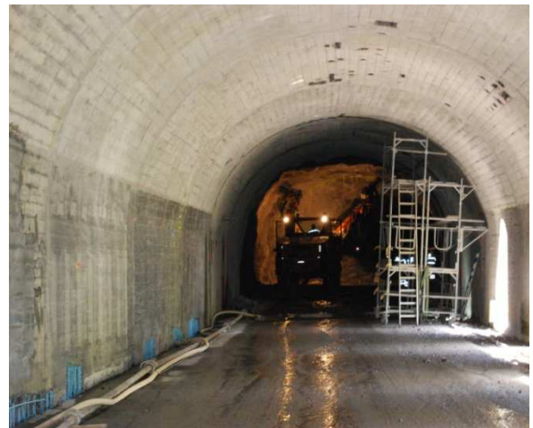
Betoninstandsetzung Galerie bei gleichzeitigem Ausbruch Tunnel